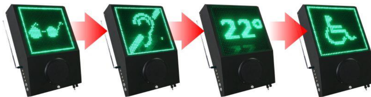
Рис. 3. Модель свето-звукового маяка «Привод-3»

Т. е. сначала незрячий человек ориентируется на слух по звуку работы радиомодуля (звуковой трансляции радиопередачи), слышимость уже возможна с расстояния 30–50 метров, далее при попадании в зону действия датчика движения радиомодуль блокируется и включается модуль речевого информатора, который голосовым сообщением точно корректирует информацию о своем местоположении.