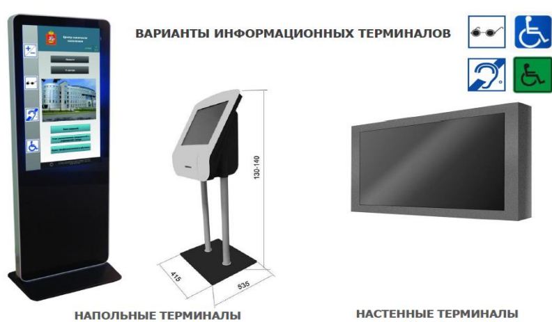
Рис. 5. Варианты информационных терминалов

Сенсорный информационный терминал и специальное программное обеспечение INVA TOUCH – комплексное информационное решение, ориентированное на все категории посетителей учреждения – в том числе на посетителей с различными формами инвалидности (рис. 5).