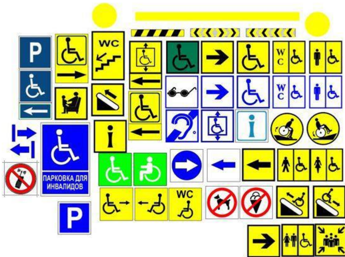
Рис. 7. Знаковые средства отображения информации

Требования к средствам отображения информации, с помощью которых инвалиды получают наощупь информацию о доступности объектов, схемах перемещения, путях эвакуации и пр., определены ГОСТ Р 52131–2003 Средства отображения информации знаковые для инвалидов. Технические требования.