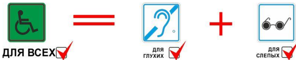
Рис. 6. Единая формула доступности информации

Информирование инвалидов в организации социального обслуживания преследует две основные цели: