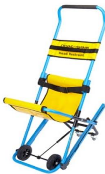
Рис. 8. Кресло для безопасного спуска и подъема по лестнице

Основными правилами эвакуации граждан в экстренных случаях и чрезвычайных ситуациях являются следующие: в случае возникновения пожара, действия работников организаций и привлекаемых к тушению пожара лиц, в первую очередь, должны быть направлены на обеспечение безопасности пребывающих в здании людей, их эвакуацию и спасение.